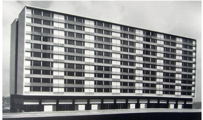
Edificio Mitre de Corsini

diferentes usos internos. La diferencia de uso más marcada esta en planta baja que si hace de transición entre el bloque privado y la calle pública, lo que genera una distinta relación con el suelo. El Mitre dialoga mas con su entorno, en un intento de generar ciudad, mientras que la Unite niega el suelo como si fuera un bucólico parque immaculado pues vuela sobre una sobra que los divide.